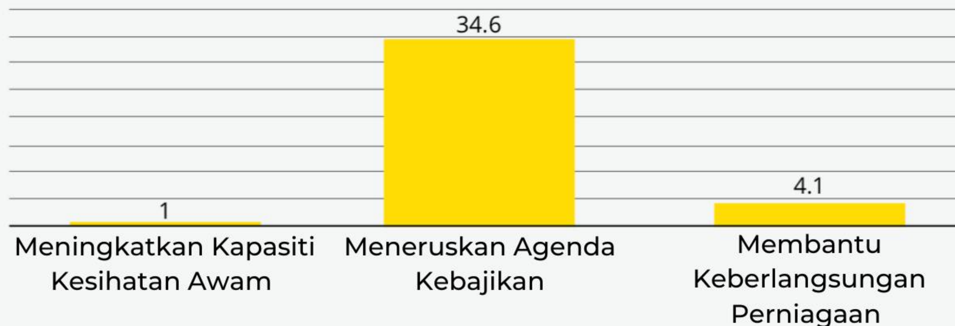
Nilai Monetari PEMERKASA+ berdasarkan tiga bidang_ (RM bilion)_